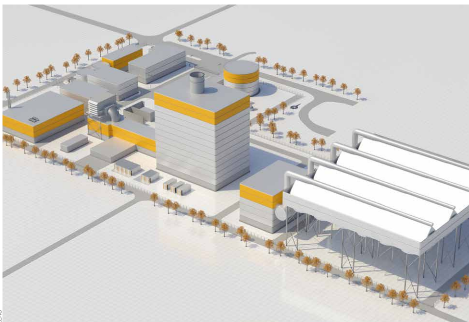
Gas- und Dampfturbinenkraftwerk

Das Unternehmen ist stark von dem regulierten Energiemarkt abhängig. In der Region sieht es aktuell nicht gut aus. In direkter Nach-