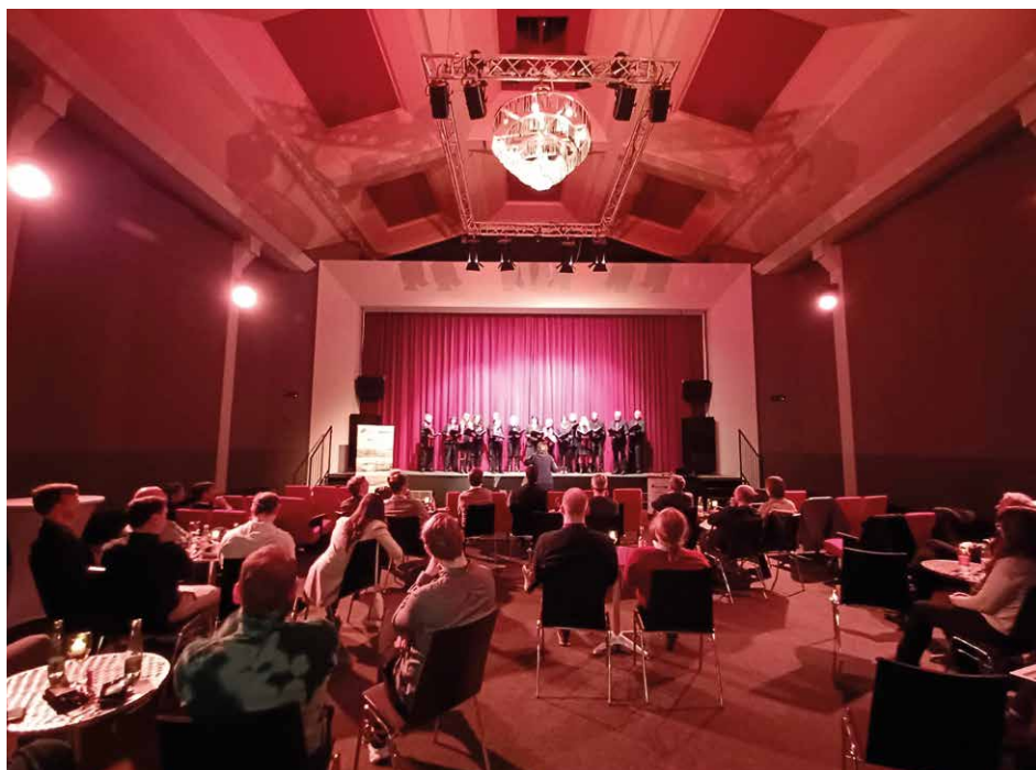
Neujahrsempfang des Büro Pegau

Christian Grötsch von der Strukturentwicklungsgesellschaft des Burgenlandkreises machte die Herausforderungen der Mobilitätswende im ländlichen Raum deutlich: Ge-