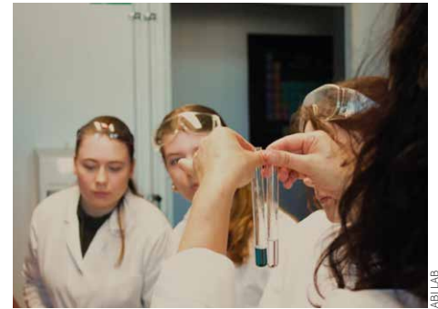
Schülerinnen besuchten im Rahmen des Girls' Day am Vormittag des 23. April 2026 die Experimentierwerkstatt ABI LAB des Forum Rathenau e. V. in Bitterfeld-Wolfen.

Ein außerschulischer Lernort im Chemiepark Bitterfeld-Wolfen