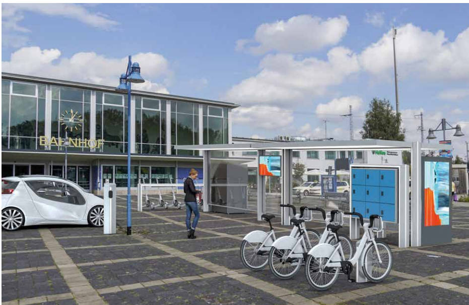
Variantenentwurf MOVE Station in Mansfeld-Südharz

Das Projekt wurde Ende September 2025 bewilligt und soll bis Ende 2028 abgeschlossen sein. Die Gesamtkosten belaufen sich auf etwa 3.200.000 Euro. Aus Strukturwandelmitteln erfolgt eine Förderung von 90 Prozent, das Land Sachsen-Anhalt beteiligt sich mit fünf Prozent an den Gesamtkosten. ■