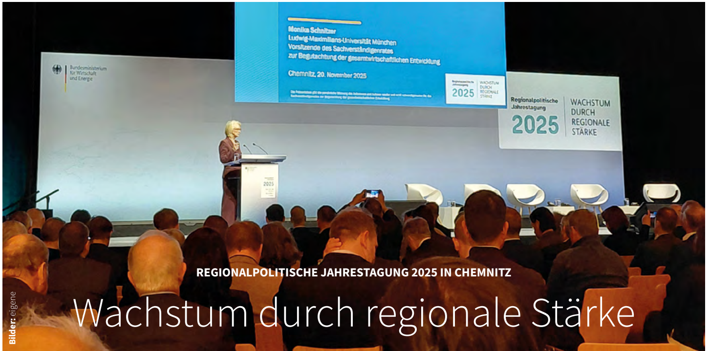
REGIONALPOLITISCHE JAHRESTAGUNG 2025 IN CHEMNITZ