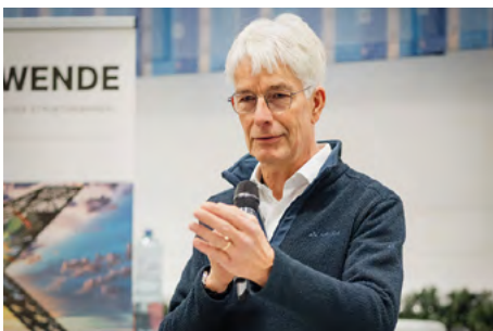
Dr. Frank Nägele, Strukturwandelbeauftragter des Saarlandes

engen Schulterschluss mit den Beschäftigten und mit einem klaren Blick auf die energie- und industriepolitischen Herausforderungen der kommenden Jahre.